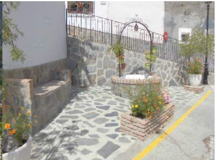
infraestruturas de lazer