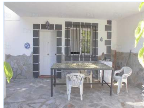
vista a partir do apartamento