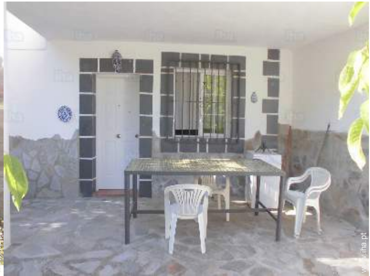
vista a partir do apartamento