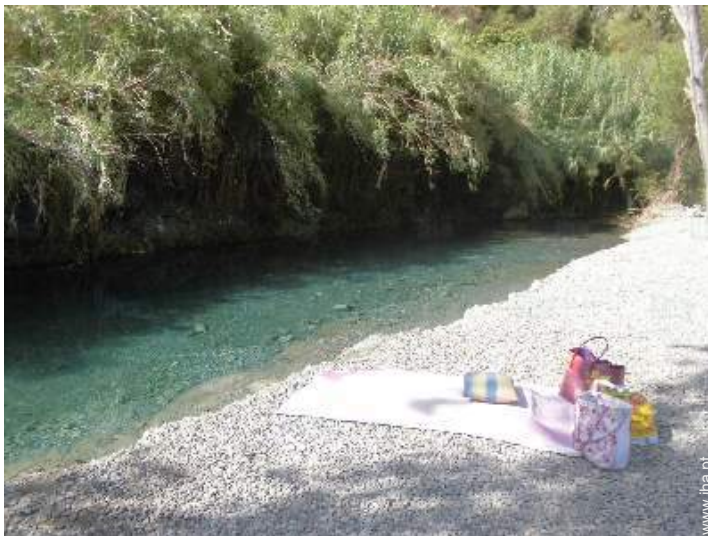
infraestruturas de lazer