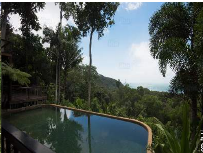
vista sobre piscina