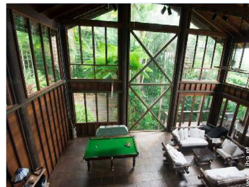
vista a partir da mezzanine