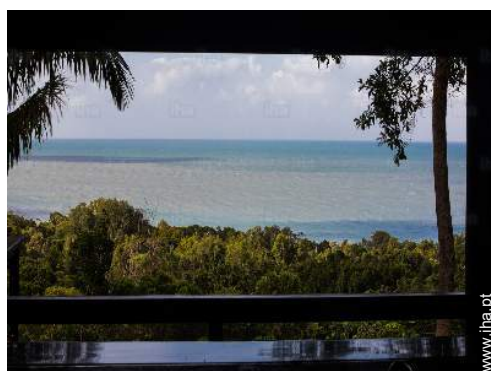
vista a partir da cozinha