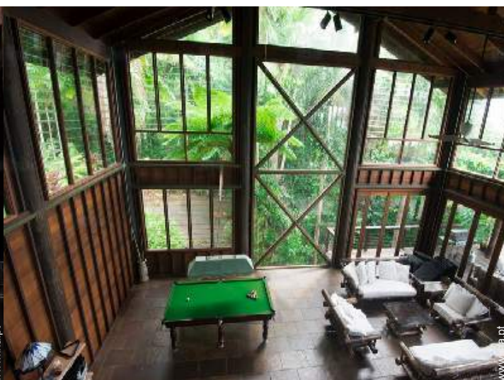
vista a partir da mezzanine