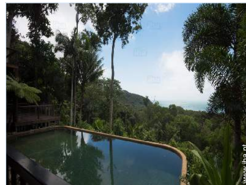
vista sobre piscina