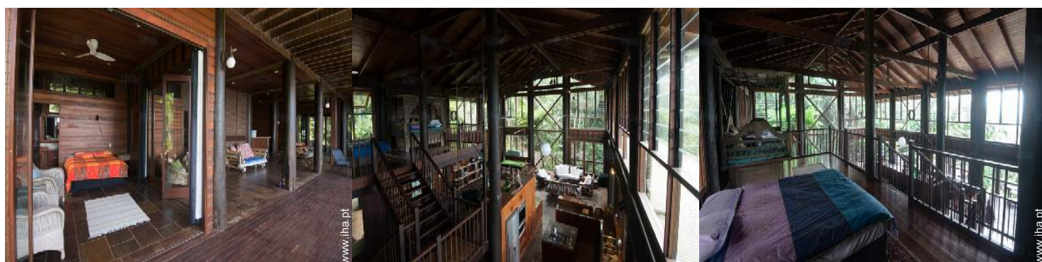
quarto de amigos