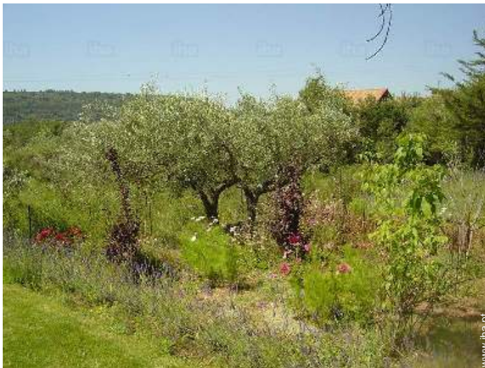
vista a partir do terraço