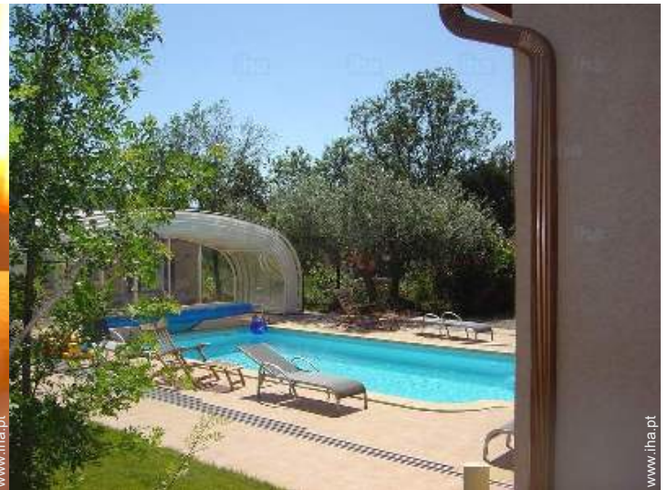
vista sobre piscina