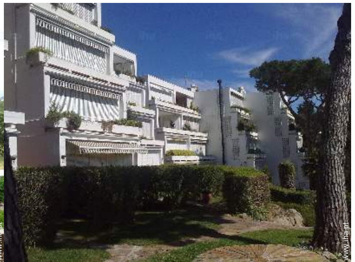
vista da propriedade