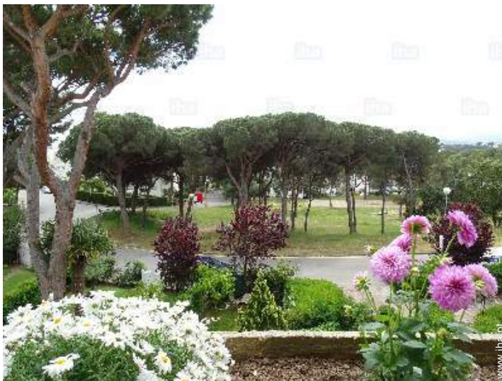
vista a partir do apartamento