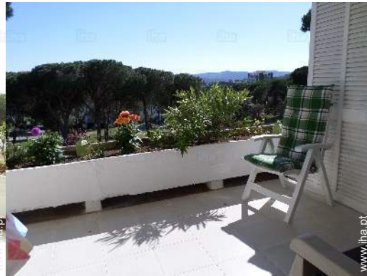
cadeira(s) de jardim