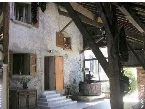
raquete(s) de ping-pong