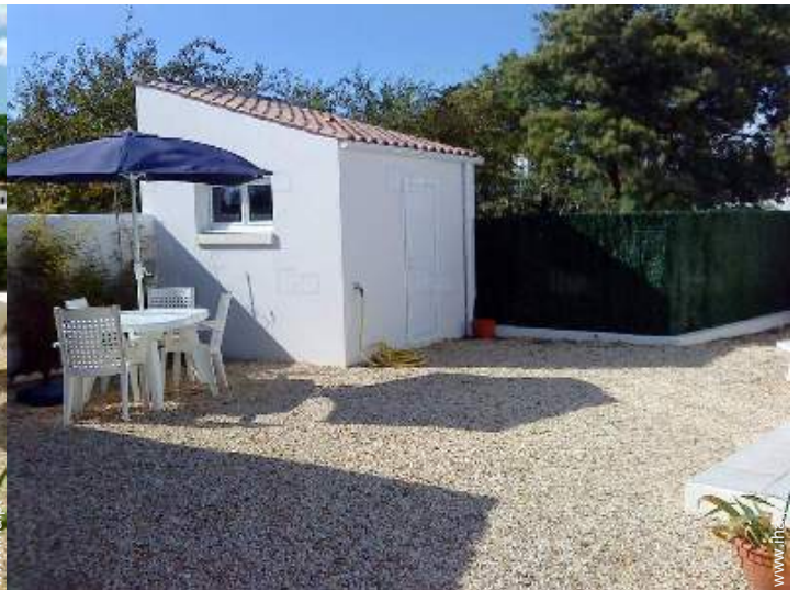
vista de pátio