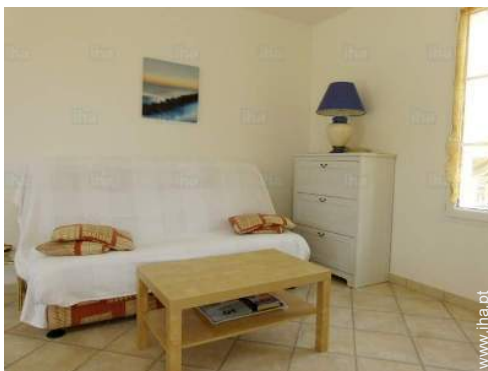
sofá(s) cama 2 pessoas