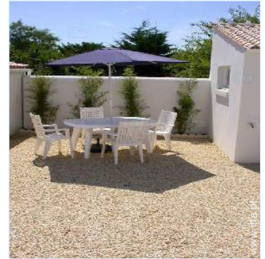
salão de jardim