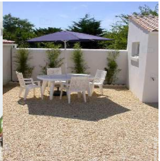
salão de jardim