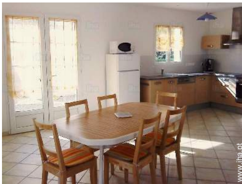
sala de estar