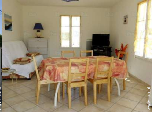
sala de estar