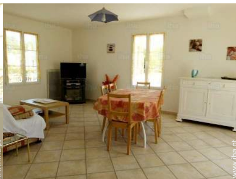
sala de estar