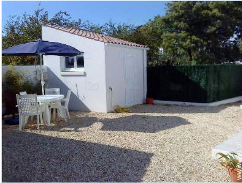
vista de pátio