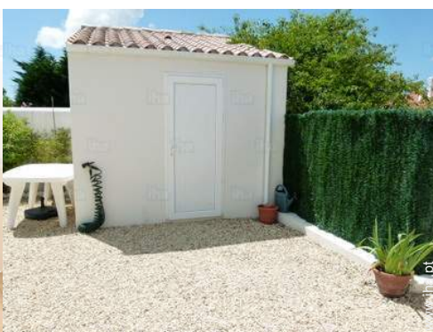
infraestruturas de lazer