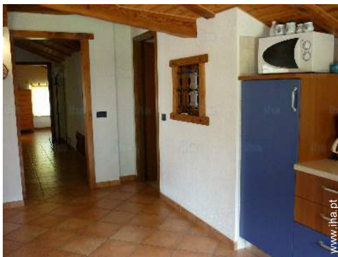
Divisões e comodidades