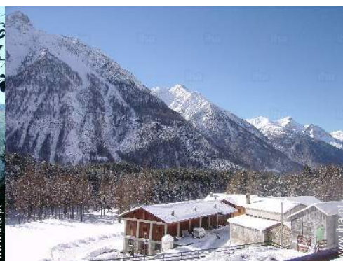
vista da propriedade