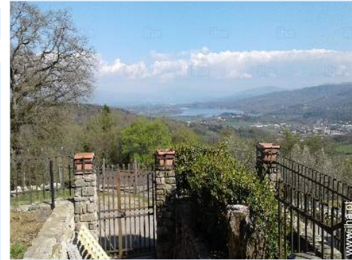
vista para lago

Mesa(s) de jardim, 6 cadeira(s) de jardim, guarda-sol