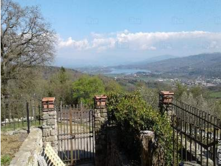
vista para lago