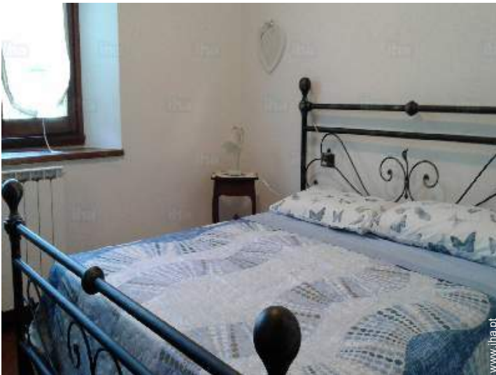
vista a partir do quarto