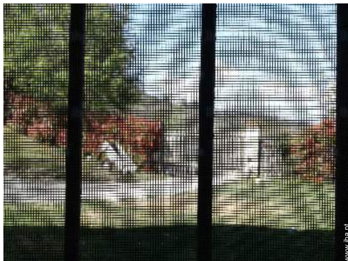
mosquiteiro nas janelas