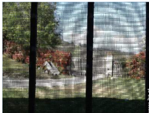
mosquiteiro nas janelas