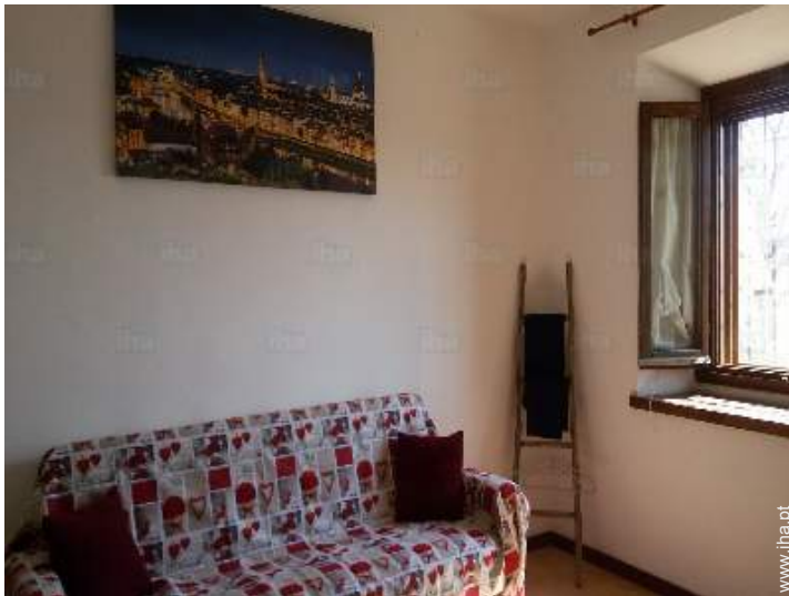
sofá(s) cama 2 pessoas