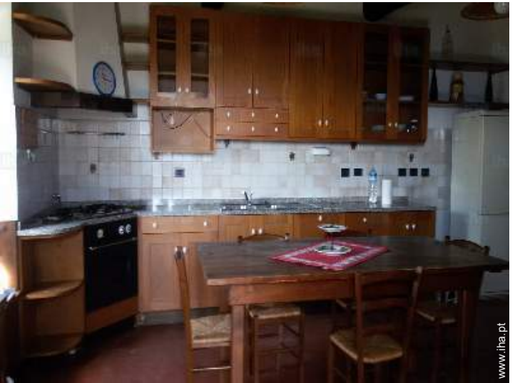
vista a partir da cozinha