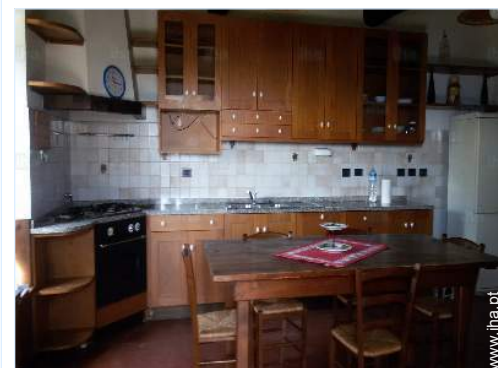
vista a partir da cozinha