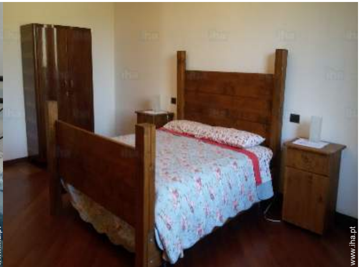
vista a partir do quarto