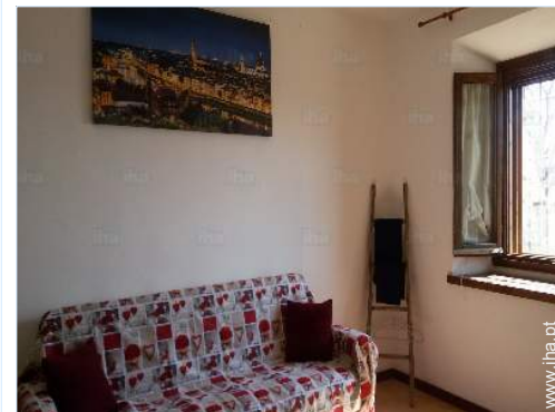
sofá(s) cama 2 pessoas