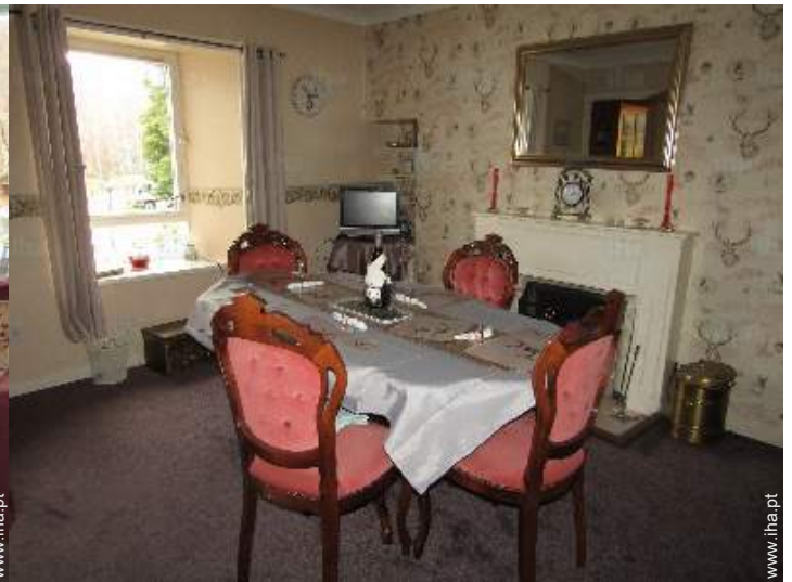
sala de jantar