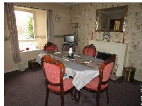
sala de jantar