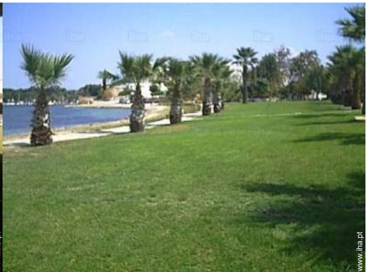
vista da propriedade