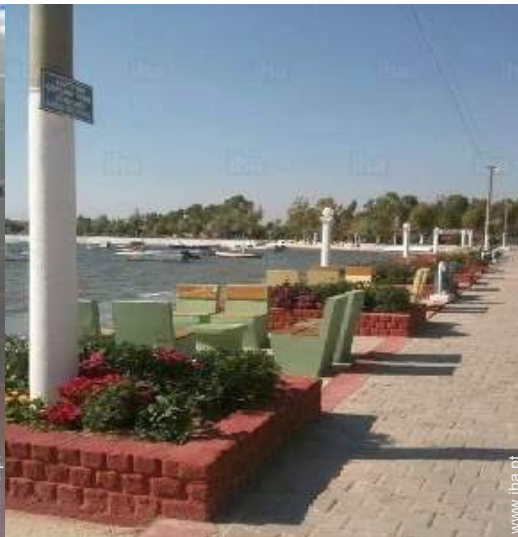
vista de porto