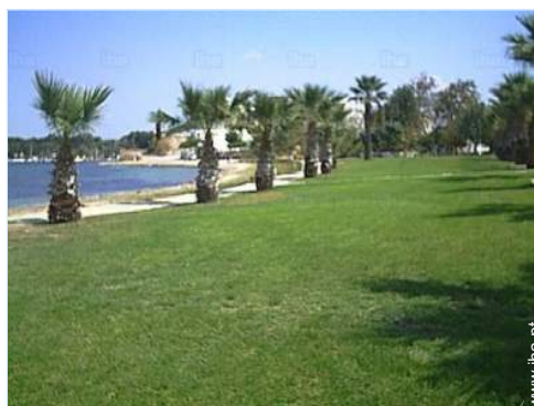
vista da propriedade