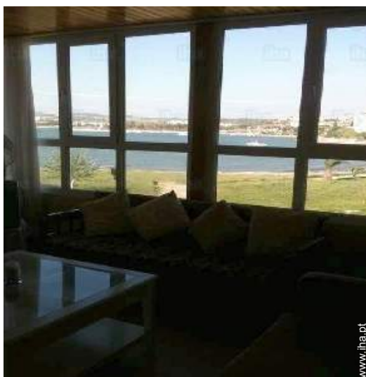
vista a partir do salão