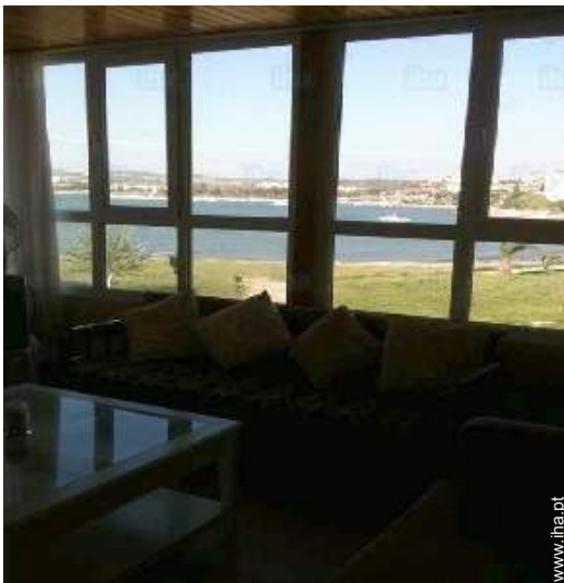
vista a partir do salão