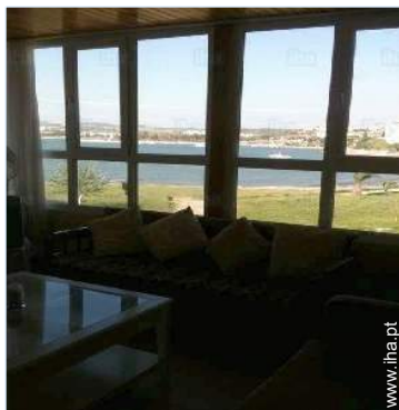
vista a partir do salão