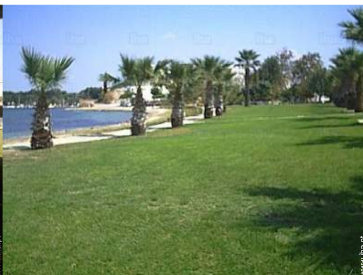
vista da propriedade