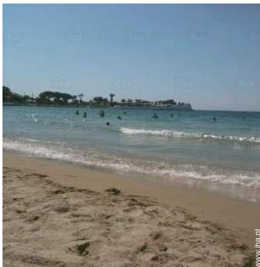
vista de mar