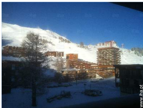
vista a partir do quarto