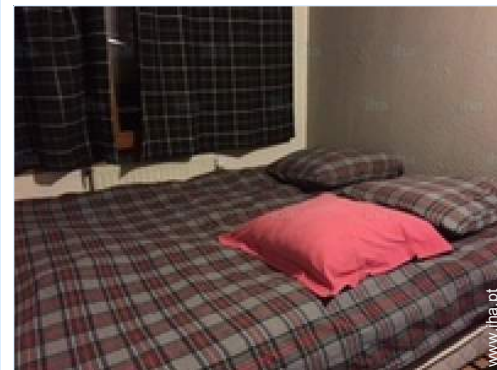
quarto de amigos

Centro aldeia 200m Paragem/estação de autocarros 200m Ligação pistas de esqui por autocarro 200m Aluguer bicicletas/BTT 200m Aluguer de equipamento de esqui 200m Aluguer roupa/lavandaria 200m Padaria 200m Comida para fora 200m Pequenos comércioos 200m Supermercado 200m Cabeleireiro 200m Banco 200m Caixa automático multibanco 200m Farmácia 200m Médico 200m Posto de saúde 200m