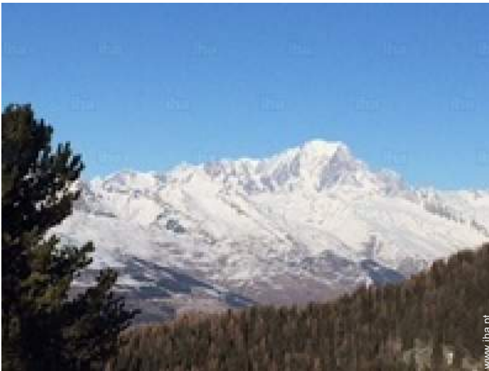
vista a partir do quarto