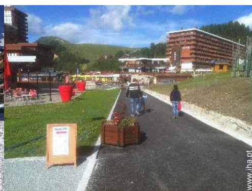
infraestruturas de lazer