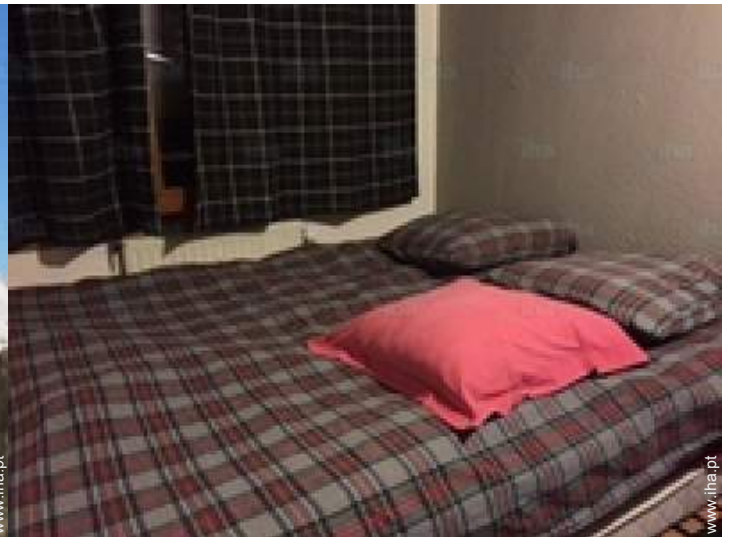
quarto de amigos