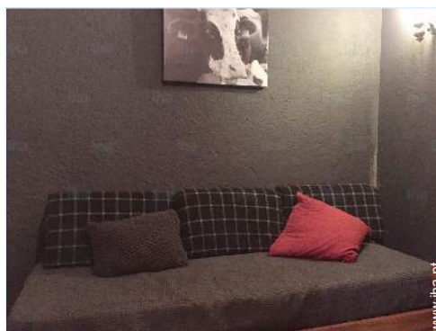
cama de gaveta 1 pessoa