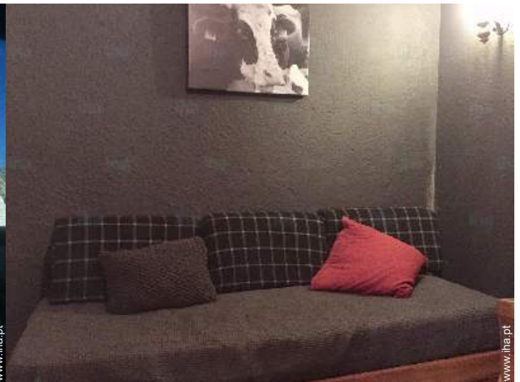
cama de gaveta 1 pessoa