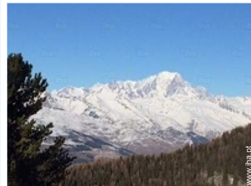
vista a partir do quarto