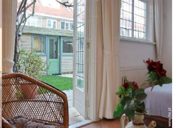
quarto de amigos