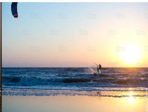
vista de mar