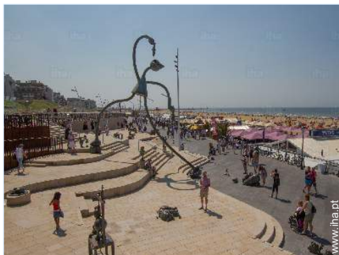
acesso directo à praia