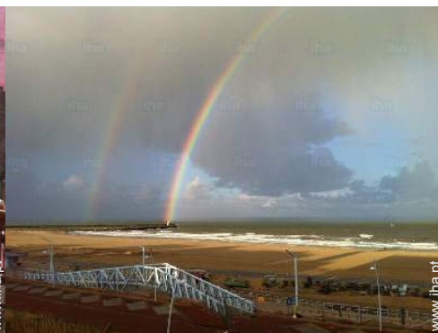
vista sobre o mar