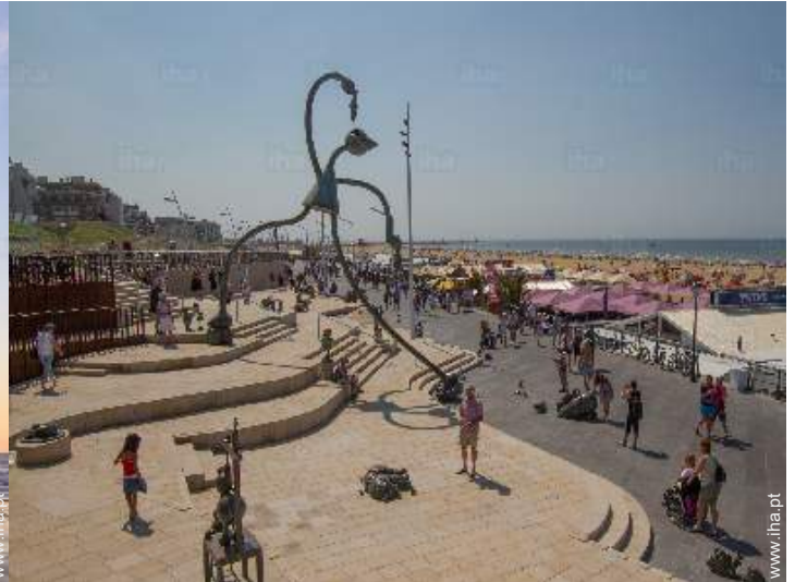
acesso directo à praia