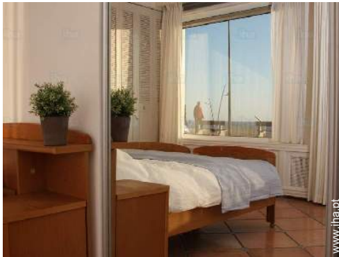
vista de mar