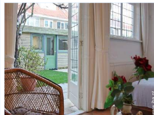
quarto de amigos