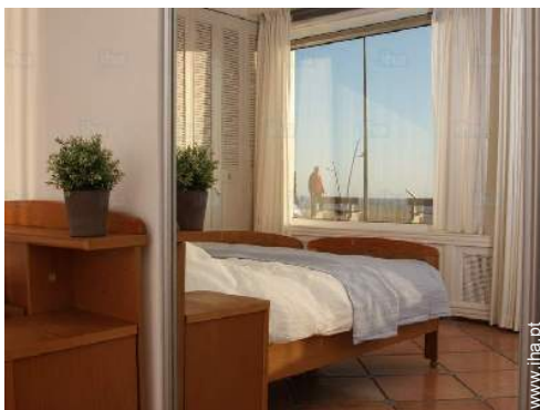
vista a partir do quarto