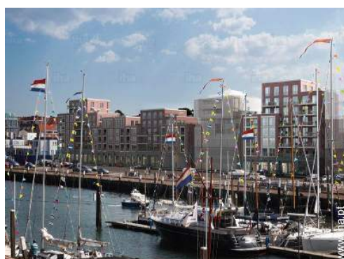
porto de recreio