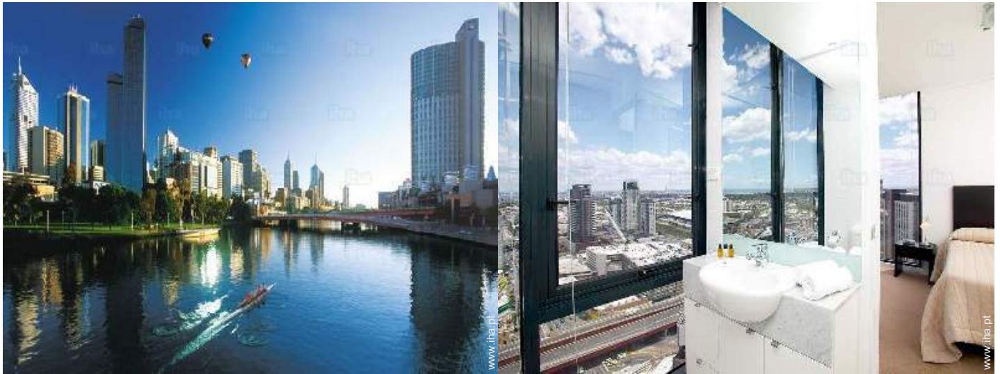
casa(s) de banho