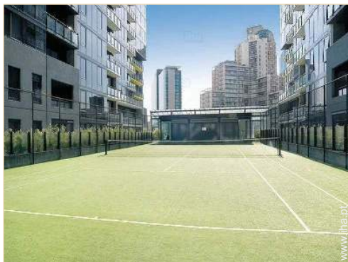
Ténis - pavimento sintético