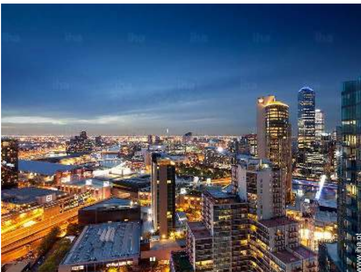
vista a partir do quarto