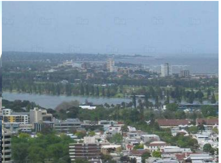
vista para lago