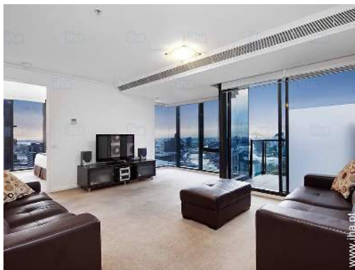
sala de estar