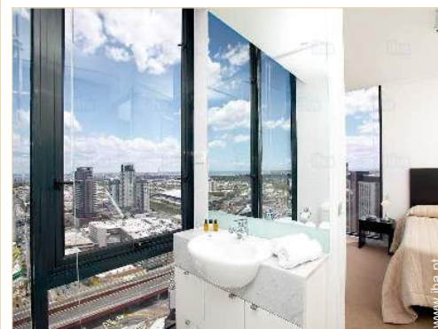
casa(s) de banho