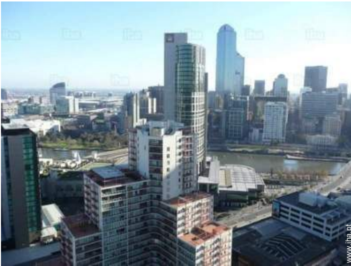
vista para rio