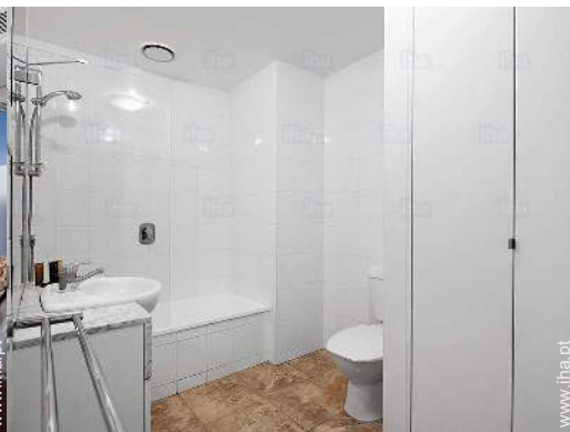
casa(s) de banho