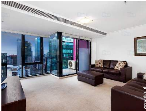
sala de estar