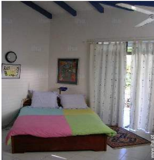
vista a partir do quarto