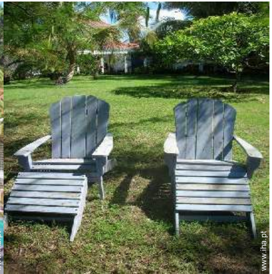
vista da propriedade