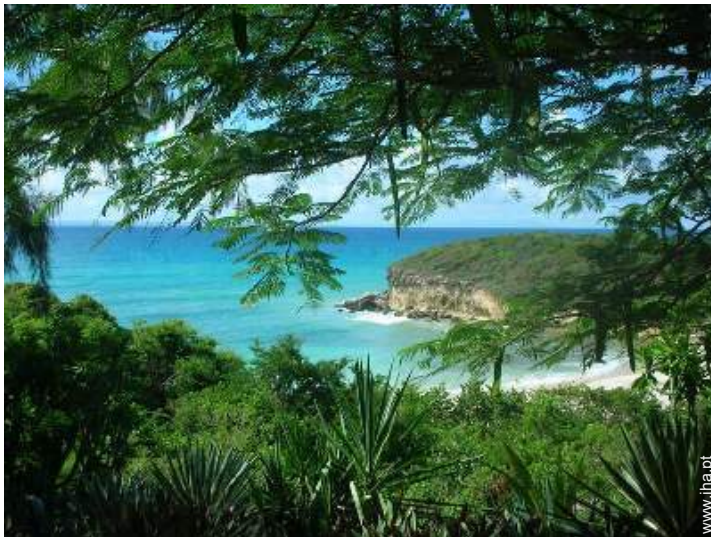
vista a partir do jardim/parque