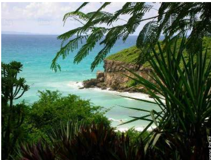
vista a partir do jardim/parque