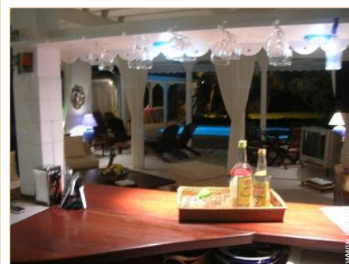
vista a partir da cozinha

Infantário 5km Centro aldeia 7,5km Paragem/estação de autocarros 1km Aluguer bicicletas/BTT 10km Aluguer de moto/scooter 7,5km Aluguer de veículos 7,5km Aluguer de barco 7,5km Aluguer de material de mergulho 10km Padaria 4km Comida para fora 4km Pequenos comércioos 4km Supermercado 4km Cabeleireiro 7,5km Cyber café 7,5km Correios 7,5km Banco 7,5km Caixa automático multibanco 7,5km Farmácia 2km Médico 7,5km Enfermeira 5km Hospital 25km