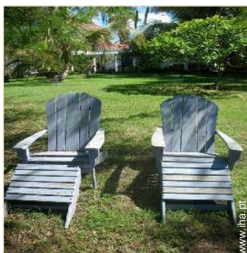
vista da propriedade