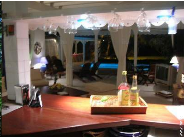
vista a partir da cozinha