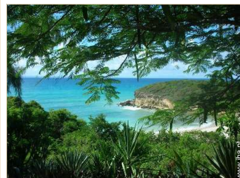
vista a partir do jardim/parque