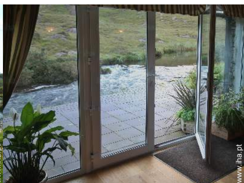
vista a partir da sala de estar