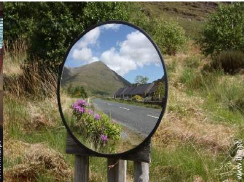
Propriedade de Encanto