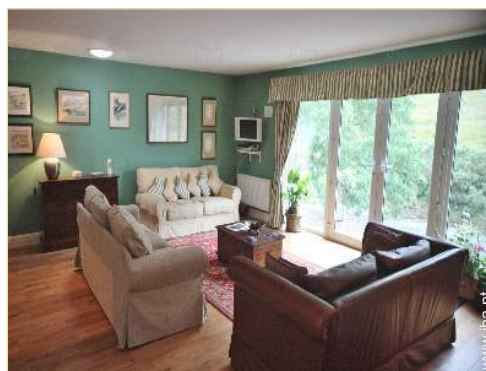
vista a partir do salão