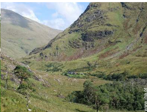
visão de conjunto