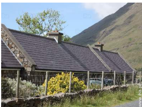
Casa de Encanto de pedra