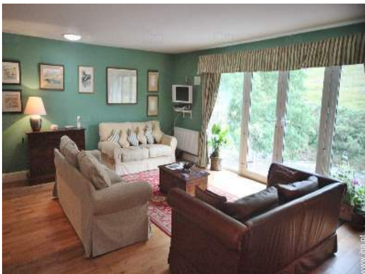
vista a partir do salão