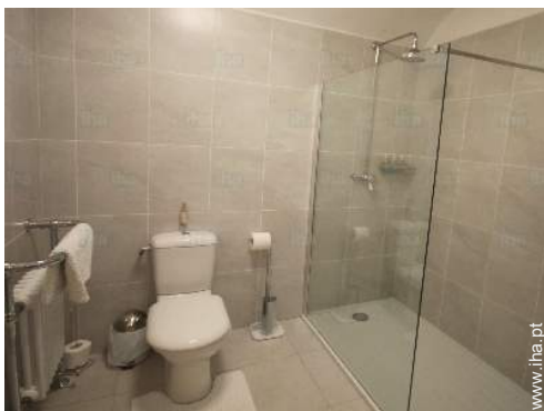
casa(s) de banho