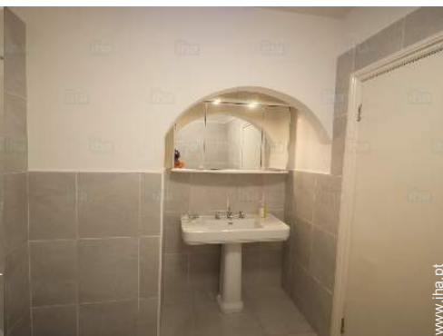
casa(s) de banho