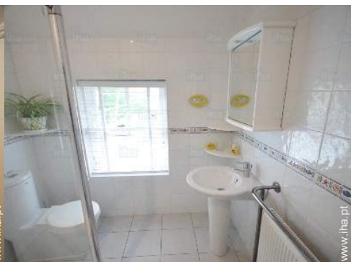
casa(s) de banho