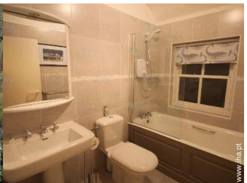
casa(s) de banho