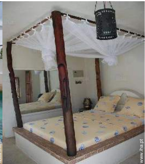
cama(s) de casal