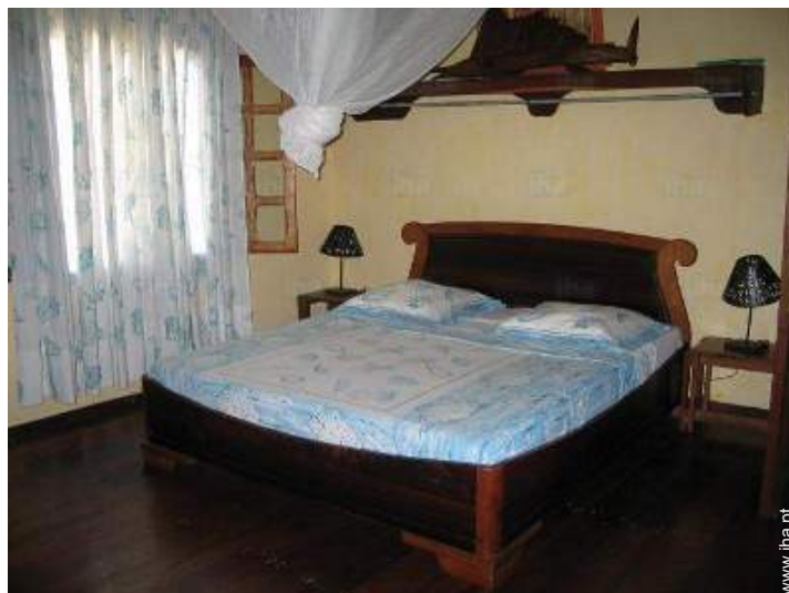
cama(s) de casal