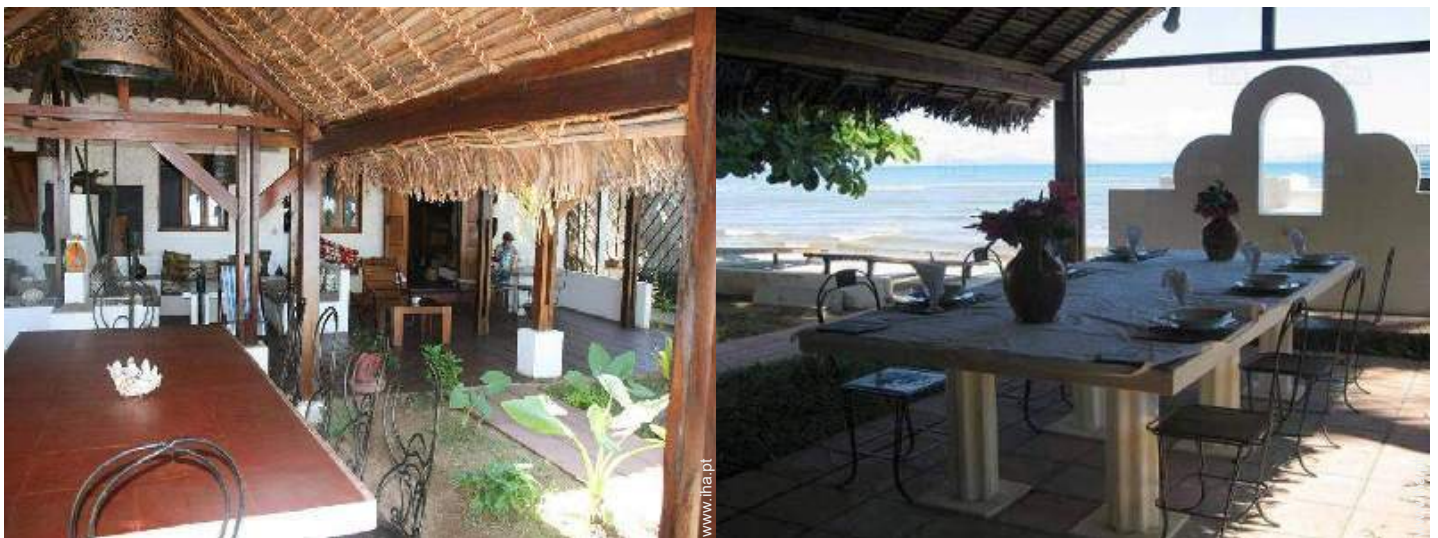
vista sobre o mar