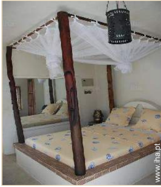
cama(s) de casal