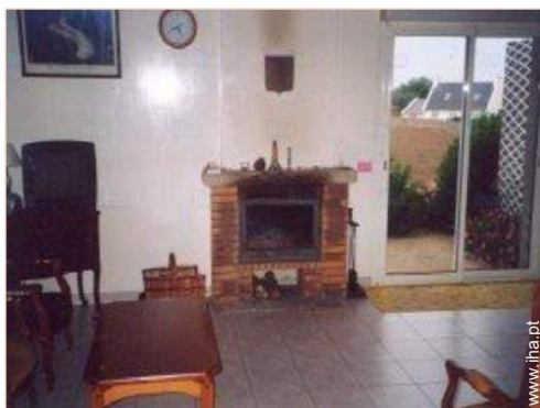
vista a partir do salão