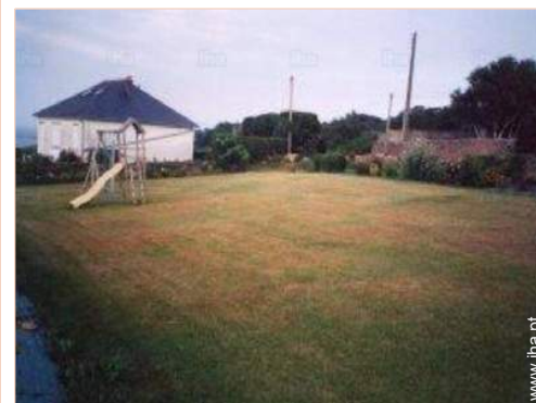
vista a partir do jardim/parque

Piscina aquecida 10km Mar/oceano 300m Praia 300m Praia de seixos 300m Praia rochosa 300m Piscina pública 10km Corte de ténis público 15km Campo de golfe 9 buracos 30km Campo de golfe 18 buracos 30km Base náutica 10km Falésia 15km Rio 10km Floresta 10km Porto de recreio 10km Passadiço flutuante para barco 300m