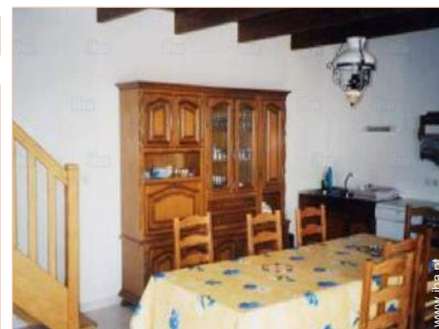
vista a partir da sala de jantar