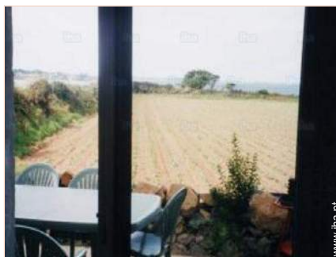
vista a partir do terraço