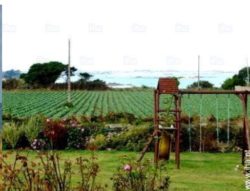
vista a partir do jardim/parque