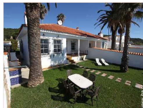
salão de jardim