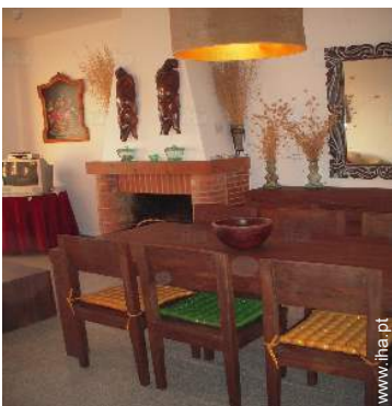
sala de jantar