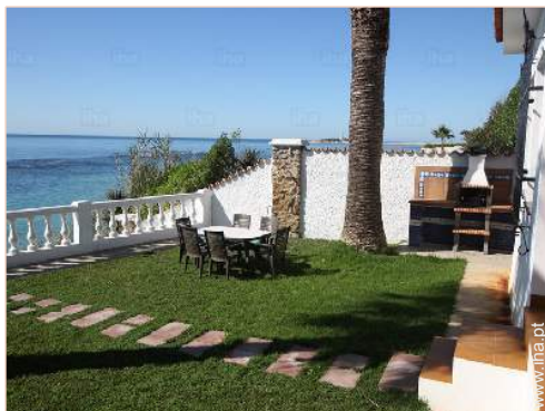
vista sobre o mar