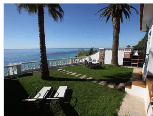
vista a partir do jardim/parque

Centro aldeia 100m Paragem/estação de autocarros 1,5km Aluguer bicicletas/BTT 50m Aluguer de veículos 15km Aluguer de barco 7,5km Aluguer de material de mergulho 7,5km Padaria 100m Pequenos comércios 100m Supermercado 7,5km Lojas de luxo e marcas 40km Cabeleireiro 7,5km Cyber café 200m Correios 7,5km Banco 7,5km Caixa automático multibanco 7,5km Farmácia 200m Médico 7,5km Hospital 40km