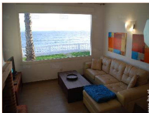
vista a partir do salão

Água : quente/fria, água imprópria para consumo