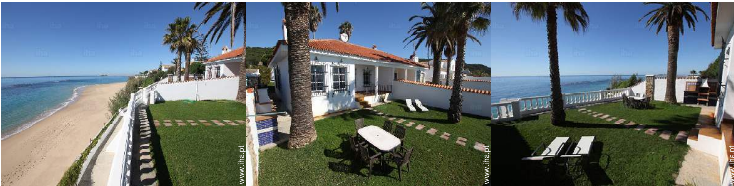
salão de jardim