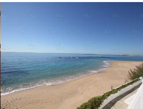
vista de mar