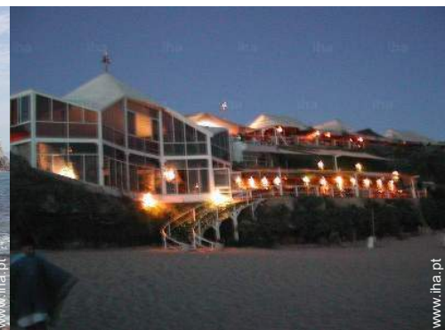
Equipamentos de lazer