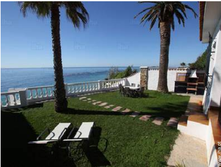
vista a partir do jardim/parque