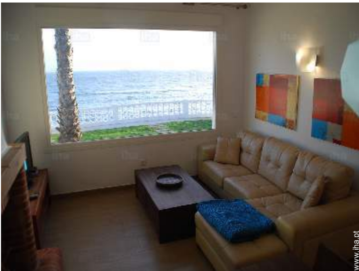
vista a partir do salão