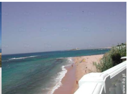
vista sobre o mar