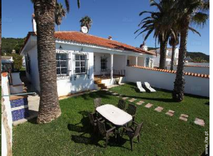
salão de jardim