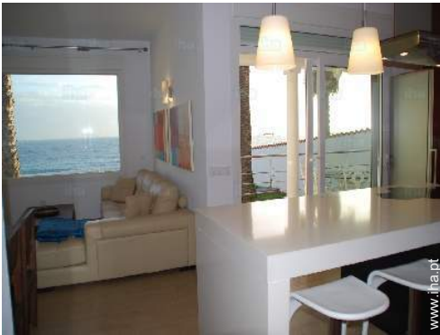
vista a partir da cozinha