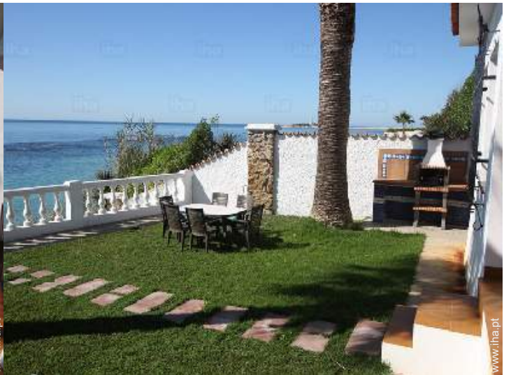
vista sobre o mar